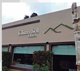
HOTEL CLIMA SOL