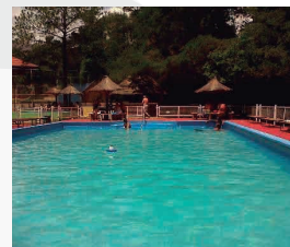
HOTEL CLIMA 3