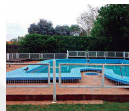
HOTEL CLIMA SOL